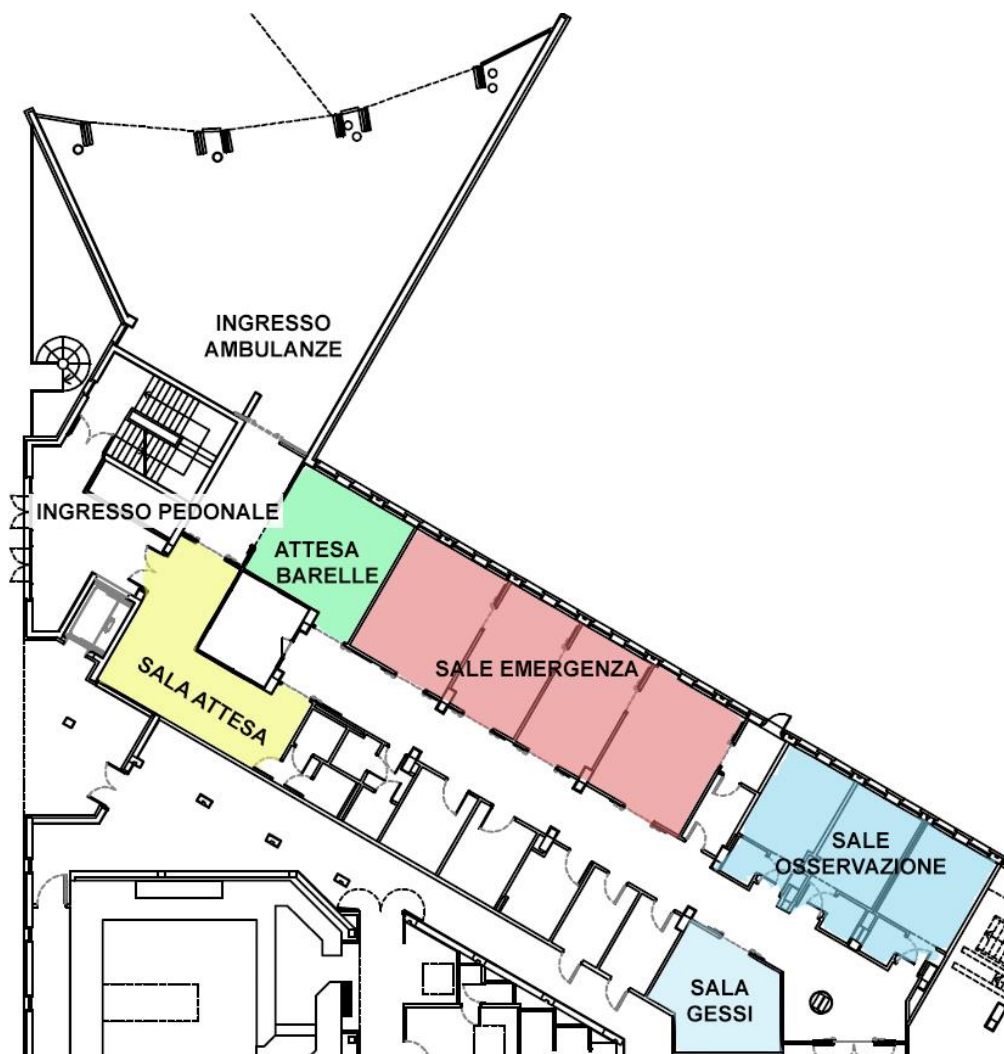
Piantina Pronto Soccorso